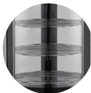
Opcional estantes rejilla cromados