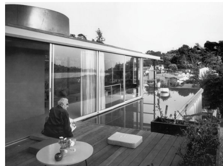
Casa del desierto - Richard Joseph Neutra